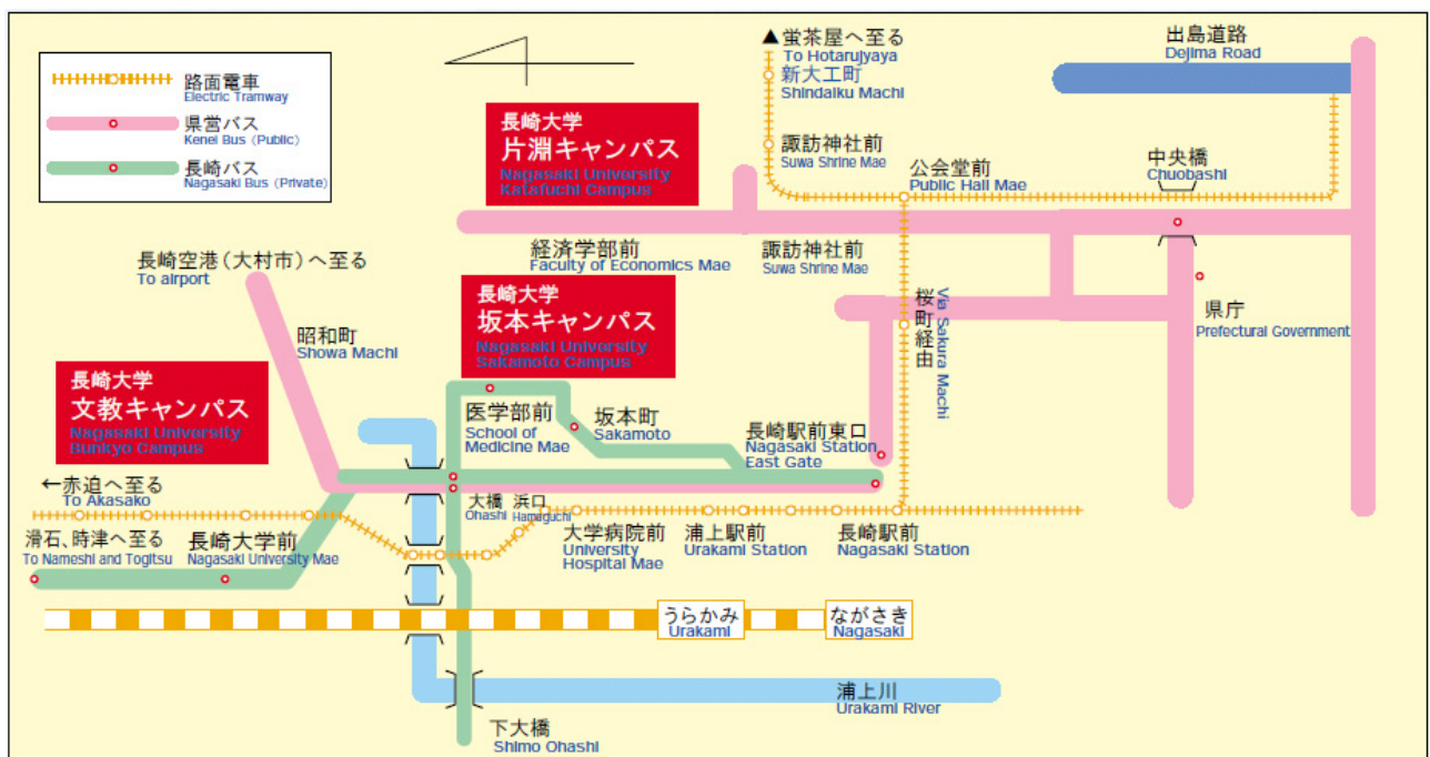
交通アクセスマップ